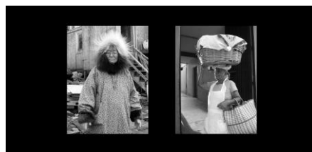
Est/Ouest © Lourdes Grobet, musée du quai Branly 2008