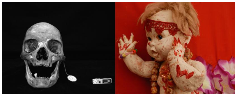
© Sammy Baloji, musée du quai Branly, 2008

« Aujourd'hui nous sommes riches de tous ces allers-retours qui contribuent au syncrétisme culturel du monde contemporain. Les voyages des hommes les voyages de la musique, les voyages de l'architecture et les voyages des rêves, voilà le sujet de mes recherches ». Sammy Baloji